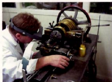
Le guillocheur actionne lui-même la machine pressant sur le chariot qui porte le burin et tournant de l'autre main la manivelle qui active la pièce

Né au XVI e siècle pour décorer des surfaces métalliques et non métalliques, le guillochage apparaît dans l'horlogerie au XVIII e siècle. C'est à cette époque que l'on cherche une solution pour rendre les surfaces métalliques plus durables afin de trouver une alternative au cuir que l'on utilisait pour revêtir les montres. En effet, sur une boîte de montre polie, les rayures sont visibles très rapidement: la gravure devient alors un excellent moyen de protéger ces surfaces de l'usure et du ternissement, tout en leur conférant un aspect décoratif. Le guillochage connaît ses heures de gloire au XIX e siècle jusqu'au début du XX e siècle. Outre ses applications en horlogerie, la technique du guillochage est utilisée alors pour la décoration d'objets divers tels que médaillons, étuis à cigarettes, briquets, tabatières, stylos, cadres, etc. Avec l'arrivée de techniques industrielles (comme la machine automatique, l'estampage ou encore les machines numériques), le métier de guillocheur sera progressivement remplacé par des opérateurs machinistes.