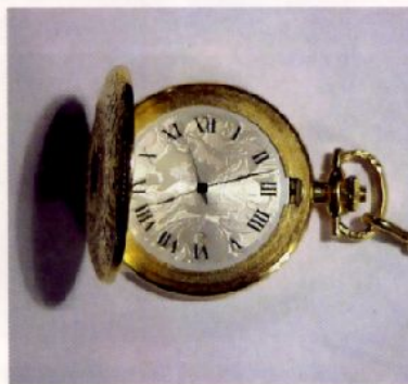
Décor réalisé par tournage (copiage)

Pouvant être effectué de façon industrielle, c'est bel et bien le guillochage «fait main» qui fait actuellement fureur parmi les grands noms de l'horlogerie. Des machines sont certes utilisées pour l'exécution, mais on parle de guillochage «main» car le guillocheur actionne lui-même la machine, pressant sur le chariot qui porte le burin et tournant de l'autre main la manivelle qui active la pièce. C'est là qu'entrent en scène la dextérité, la précision et la sensibilité de l'artisan. La valeur d'une pièce effectuée à la main est très élevée par rapport à une pièce industrielle (les «copies» de guilloché peuvent être reproduites par étampage par exemple) et l'aspect final est incomparable: les lignes guillochées réfractent la lumière de façon extraordinaire. Les marques actives dans le haut de gamme sont parfaitement conscientes de la dif-